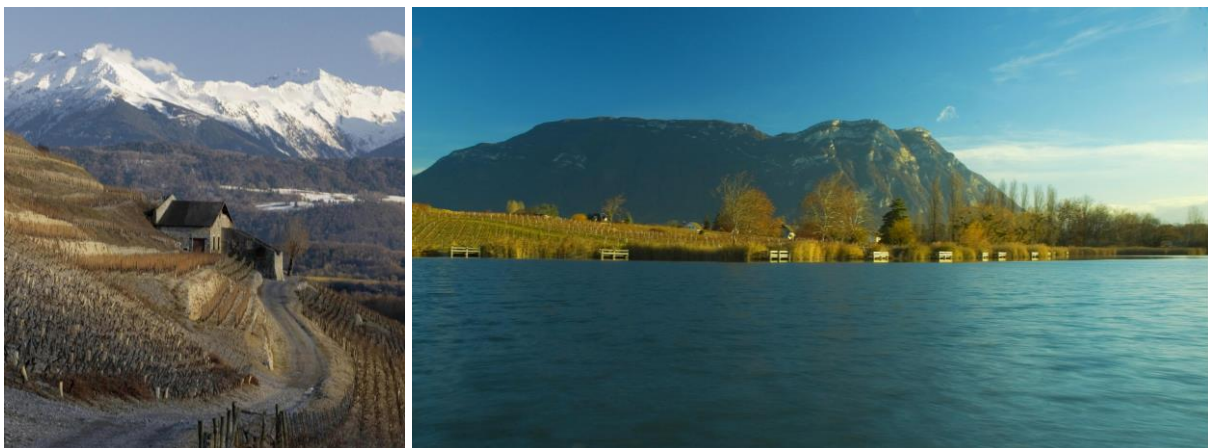
La vigne, la montagne et l'eau

Elle s'est également établie sur le versant occidental de la montagne du Chat (Marestel, Monthoux, Jongieux) et de la Cluse de Chambéry (Monterminod, St Jeoire Prieuré, Chignin, Chignin Bergeron, Apremont et Abymes qui débordent sur l'Isère). Enfin, les dénominations géographiques Montmélian, Arbin, Cruet et St Jean de la Porte bénéficient d'une exposition sud-est sur la rive droite de la Combe de Savoie.