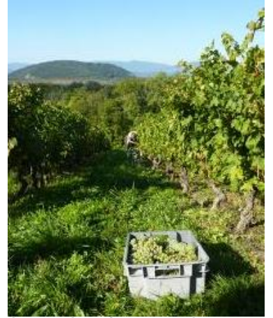
Vendanges du Crémant en Chautagne

Depuis quelques années des vignerons avaient choisi d'élaborer leurs effervescents selon le cahier des charges Crémant. Les premiers vins montrent un style très actuel : des notes de fruits blancs et d'agrumes, de la fraîcheur, des dosages précis et limités pour l'élégance et la finesse. Les consommateurs vont pouvoir découvrir ces Crémants dès Noël 2015, la mise en marché ayant lieu après une période d'élevage de 12 mois minimum. Cette mention Crémant de Savoie est un véritable atout pour la région : le potentiel de développement commercial est réel, en particulier à l'export.