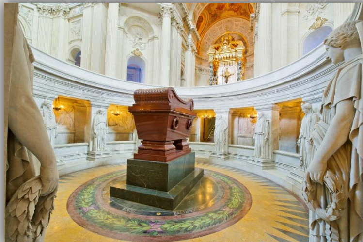
© Musée de l'Armée – Paris /dist. RMN Tombeau de Napoléon 1 er

Située au pied de l'église, d'une superficie de plus de 2000 m 2 , la vaste cour du Dôme fait face à l'actuelle place Vauban. Encadrée de part et d'autre par des jardins et fontaines, elle permet aux visiteurs d'accéder sur le site des Invalides de façon majestueuse en leur proposant une vue unique sur l'église et le monument. En soirée, magnifiquement éclairé, le Dôme s'illumine et constitue un des points de repère du paysage parisien.